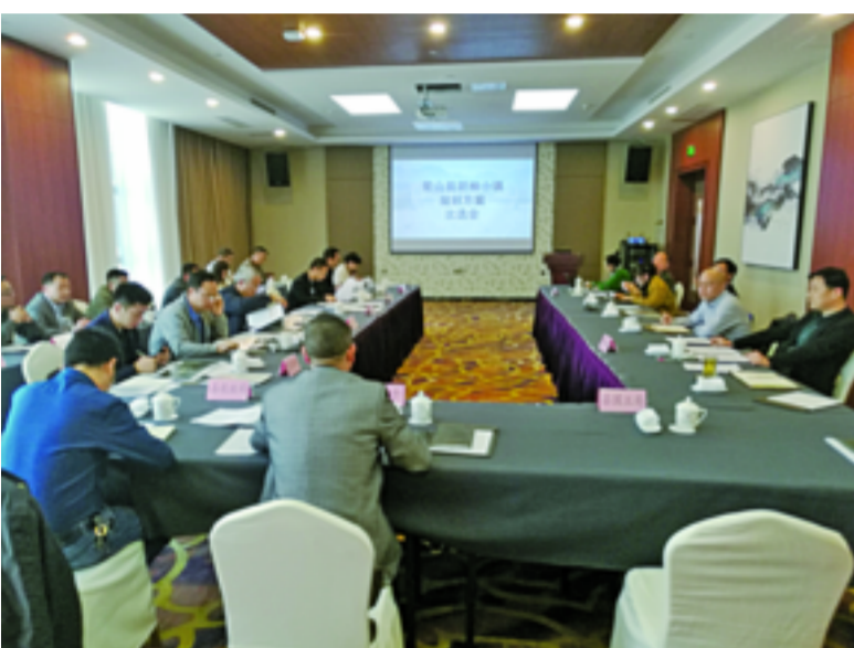
胡柚小镇规划方案比选