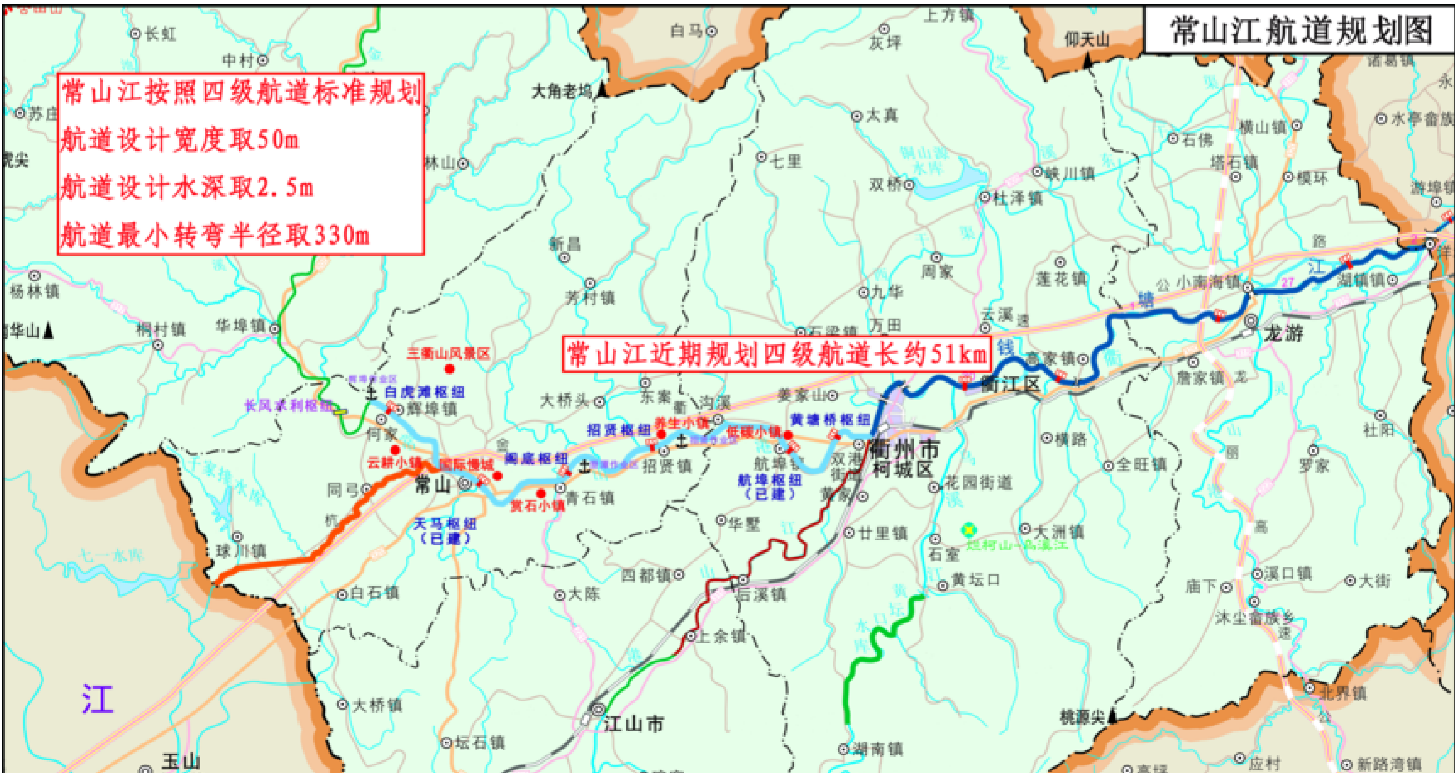
常山江航道规划图

我们有理由相信,在县委、县政府的决策部署下,全县上下齐心发力,就一定能把常山打造成为大湾区战略节点的两江通道、大通道浙西门户的通衢首站、大花园核心景区的慢城风光、大都市区绿色卫城的康养福地。