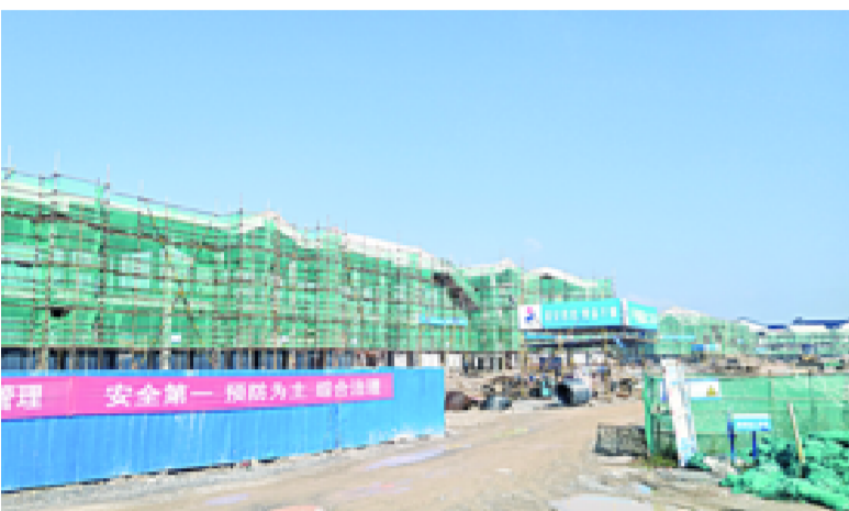
建设中的中国观赏石博览园第二功能区