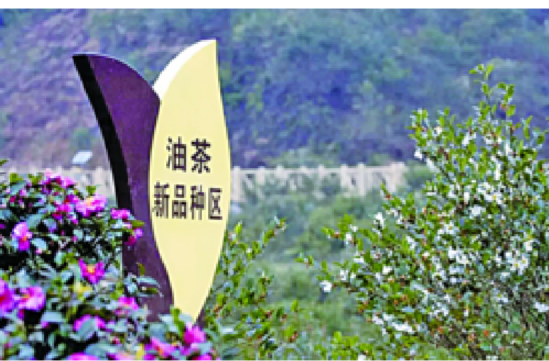
油茶公园新品种区